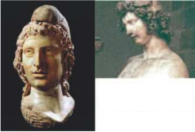
Mithras (vas.) ja Bacchus

täysin ”kirkkautta vailla” ja jatkuva muistutus syntiin langenneesta ihmisestä. Siksi fyysisessä ihmisolemuksessa ei ole mitään millä kerskata Jumalan edessä. Raamattukin mainitsee, että Jeesus ”otti orjan muodon” (Fil. 2:7) tullessaan lihaan. VT:n puolella, Jes. 53 luku kuvaa Jeesuksen olemusta mutta ristiinnaulittuna ja runneltuna – siinä ei ole mitään inhimillisesti ylevää eikä kaunista, vaan sitä ”näkemästä kaikki kasvonsa peittivät” (53:3), ”ei ollut hänellä muotoa, johon me olisimme mielistyneet” (53:2).