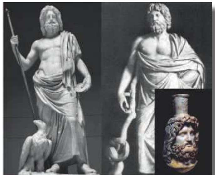
Zeus (vas.), Asklepius ja Sarapis (pikkukuva).