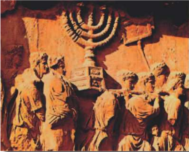
Tiituksen riemukaareen Roomassa on kuvattu juutalaisia sotavankeja: miehillä on lyhyet hiukset.

konnon monet piirteet periytyivät sen jälkeen syntyviin uskontoihin. Egyptissä tätä jumaluutta edusti Osiris, Persiassa Mithras, Kreikassa Bacchus, jne. Näiden jumalien kuoleman ja ylösnousemuksen muistojuhlaa niiden lukuisat seuraajat viettivät vuosittain. Kun Rooman valtakunnassa uskonnollinen sallivuus laajeni käsittämään kristillisen uskon, Jeesus liitettiin vaikeuksitta muiden jumalien rinnalle. Koska pakanajumalilla oli "kasvot", sellaiset piti saada myös Jeesukselle. Pitkätukkainen Jeesus edustaa samaa jumalakuva, jollaisena jo aiemmin mm. Bacchusta oli kuvattu. Myöhemmin kirkkotaide otti käyttöönsä saman kuvauksen. Poikkeuksesta Jeesukselle annetaan pitkät hiukset, jotka monissa tauluissa valuvat lievästi kihartuen olkapäille. Tukan värikin on usein kullanhohhtoisen vaalea.