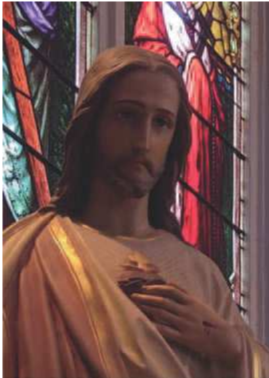
Pitkä- ja vaaleatukkainen Jeesus on tavallinen näky room.kat. ja ortodoksi-kristillisissä kuvissa.

Joillekin saattaa olla yllätys, että Toora (VT) puhuu ihmisen hiuksista. Monille on tuttu 3. Moos. 19:27 juutalaismiehiä koskeva parranajokielto. Vähemmän tuttua lienee se, että 3. Moos. 10:6 mainitaan pappeja koskien vakava kielto: ”Älkää päästäkö tukkaanne hajalle”. Tämä sääntö liitettiin koskemaan kaikkia juutalaismiehiä ja perinteen mukaan sen on aina ymmärretty sisältävän, että ”älä anna hiustesi